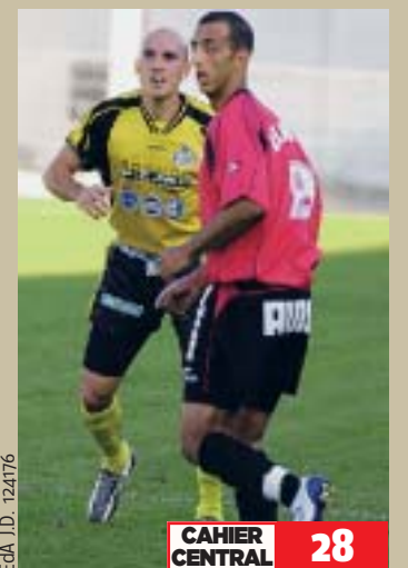
EdA J.D. 124176